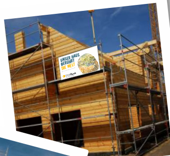
ig aus Rastatt