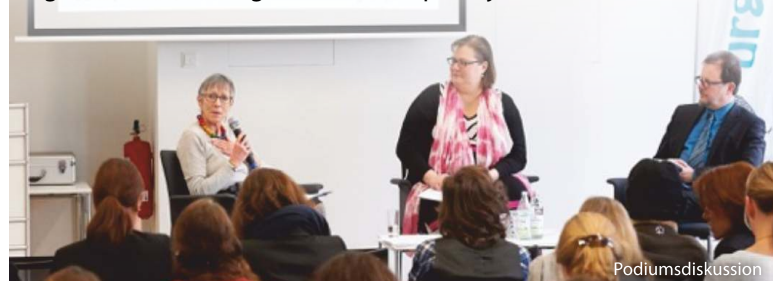
Podiumsdiskussion während der Tagung "Entwicklungsbanken und Menschenrechte"

Zurzeit arbeiten wir mit einem internationalen Netzwerk von Aktivisten daran, eine Verwässerung der Weltbank-Standards zu verhindern. Entgegen seiner mehrfachen Versprechen hat Weltbank-Präsident Jim Yong Kim einen Entwurf vorgelegt, der den Schutz von Menschen und Umwelt stark einschränkt. Schlimmeres als bisher zu vermeiden, das ist leider die dringlichste Aufgabe, die vor uns liegt. Es ist ein Kampf um jeden Millimeter.