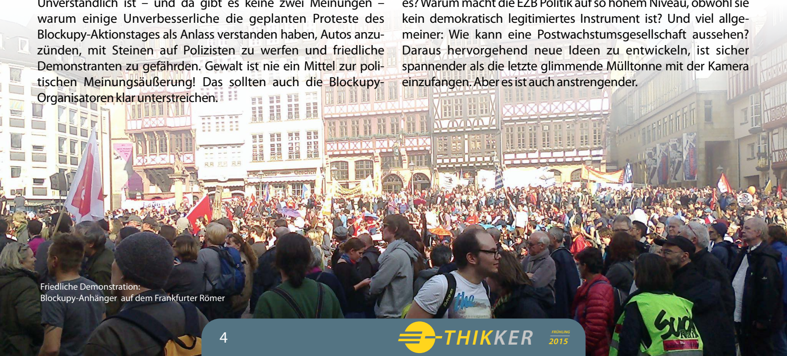
Friedliche Demonstration: Blockupy-Anhänger auf dem Frankfurter Römer

Unverständlich ist aber ebenso, warum die Berichterstattung über sinnlose Ausschreitungen so viel Raum einnimmt, die Inhalte der Proteste jedoch kaum thematisiert werden. Statt darüber zu berichten und zu informieren, warum sich tausende Menschen, darunter auch Mitarbeiter der EthikBank, an einem Wochentag in der Frankfurter Innenstadt versammeln, um gegen Ungerechtigkeit, Raubtierkapitalismus und damit einhergehende Verarmung zu demonstrieren, verhelfen viele Medienvertreter den Krawallen zu der Aufmerksamkeit, die sie beabsichtigten aber nicht verdienen. Die friedlichen Kundgebungen, die am Nachmittag des 18. März stattfanden, waren in den Abendnachrichten dann nicht mehr als eine Randnotiz. Zu wenige Reporter übermittelten die Fragen, um die es eigentlich geht: Ist die Austeritätspolitik der EZB das richtige Mittel, um die Eurokrise zu bekämpfen? Welche Alternativen gibt es? Warum macht die EZB Politik auf so hohem Niveau, obwohl sie kein demokratisch legitimes Instrument ist? Und viel allgemeiner: Wie kann eine Postwachstumsgesellschaft aussehen? Daraus hervorgehend neue Ideen zu entwickeln, ist sicher spannender als die letzte glimmende Mülltonne mit der Kamera einzufangen. Aber es ist auch anstrengender.