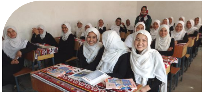
Freuen sich über Ihre Hilfe: Die Mädchen und Frauen der Nahr-e-Top Mädchenschule

Vielen Dank für Ihre Hilfe! Sie kommt bei denen an, die sie wirklich benötigen.