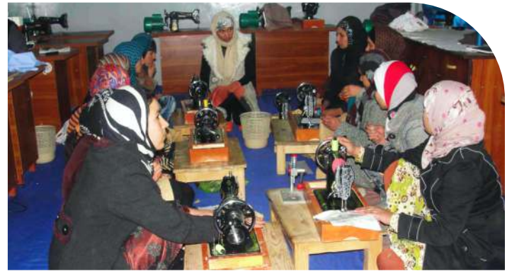
Berufliche Perspektiven: Angehende Näherinnen unseres Förderprojektes

Wir können damit schnell und unkompliziert helfen. Für unsere großen Schul-Bauprojekte beantragen wir Fördermittel. Da können wir ganz klar beschreiben was wir planen und was wir erreichen wollen. Unsere Zielsetzung ist eindeutig: Bildung ermöglichen. Vor Ort ergeben sich dazu dann auch ganz konkrete, ungeplante Probleme. Da sind Spendengelder nützlich, zum Beispiel für Reparaturarbeiten, Bücher, neue Klassenräume. Hilfe zur Selbsthilfe, darauf beruht unsere Arbeit.